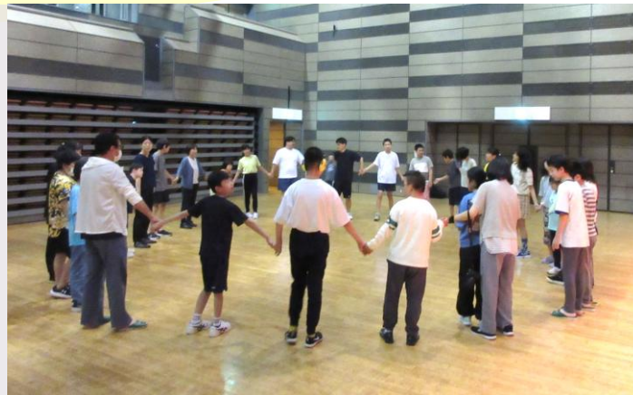
夜のレクリエーション

二日目に、工房でサンドブラスト体験をしました。コップにシールを貼り、砂を吹き付けることで模様が浮かびあがります。細かい作業に苦戦しましたが、素敵なコップに仕上げることができました。 高尾山トリックアート美術館では、ワニやぞうのトリックアートの迫力に圧倒されましたが、実際に体験したり写真を撮ったりして、楽しみながら見学ができました。