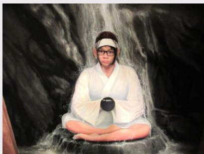
トリックアート美術館