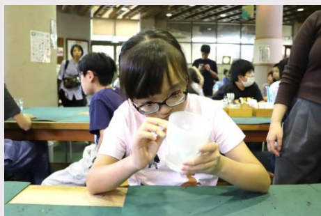
サンドブラスト体験

中学部一年生は10月2日～3日の一泊二日で、藤野芸術の家で移動教室を行いました。中学部に入って初めての宿泊行事を楽しみにしており、充実した2日間を過ごすことができました。